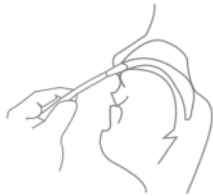
ENTWEDER: Entnahme des Abstrichs anterior