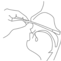
ODER: Entnahme des nasopharyngealen Abstrichs