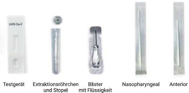
Testgerät Extraktionsröhrchen und Stopel Blister mit Flüssigkeit Nasopharyngeal Anterior